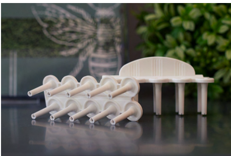
LH8021ZA - ComforTen

LH8406ZA ComforTen® Covered 30-Hole Tray / Plateau pour test (30-Réservoir) 1 LH8407ZA ComforTen® Covered 60-Hole Tray / Plateau pour test (60-Réservoir) 1 LH8924ZA Skin Test Reservoir / Réservoir 30 LH8021ZA ComforTen® Multiple Skin Test Device / Applicateur multiple (10 Tests / Device) 81 LH8400ZA Quintip® Skin Test Device / Applicateur unique (1 Test / Device) 1800