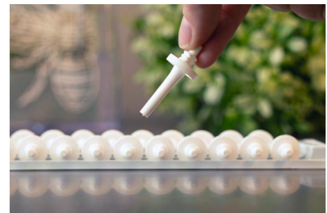
LH8400ZA - Quintip